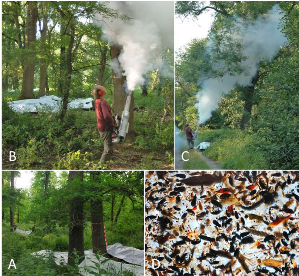
Foto Tableau 1: A) Vor dem Baumkronenvernebelung werden Fangplanen unter der Baumkrone installiert, so dass Arthropoden von Nachbarbäumen ausgeschlossen werden können und man eine baumspezifische Probe erhält. B, C) Für einige Minuten wird mit einem speziellen Vernebelungsgerät (SN-50) ein Gemisch von natürlichem Pyrethrum und einem paraffinähnlichen Weissöl in die Krone geblasen, das als weißer Rauch sichtbar ist. D) Eine sortierte Probe zeigt die Zusammensetzung der Kronenfauna.